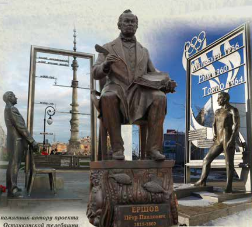
памятник автору проекта Останкинской телебашни Николаю Никитичу