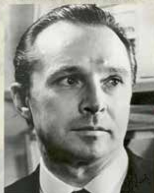
портрет детского писателя Валерия Медведева