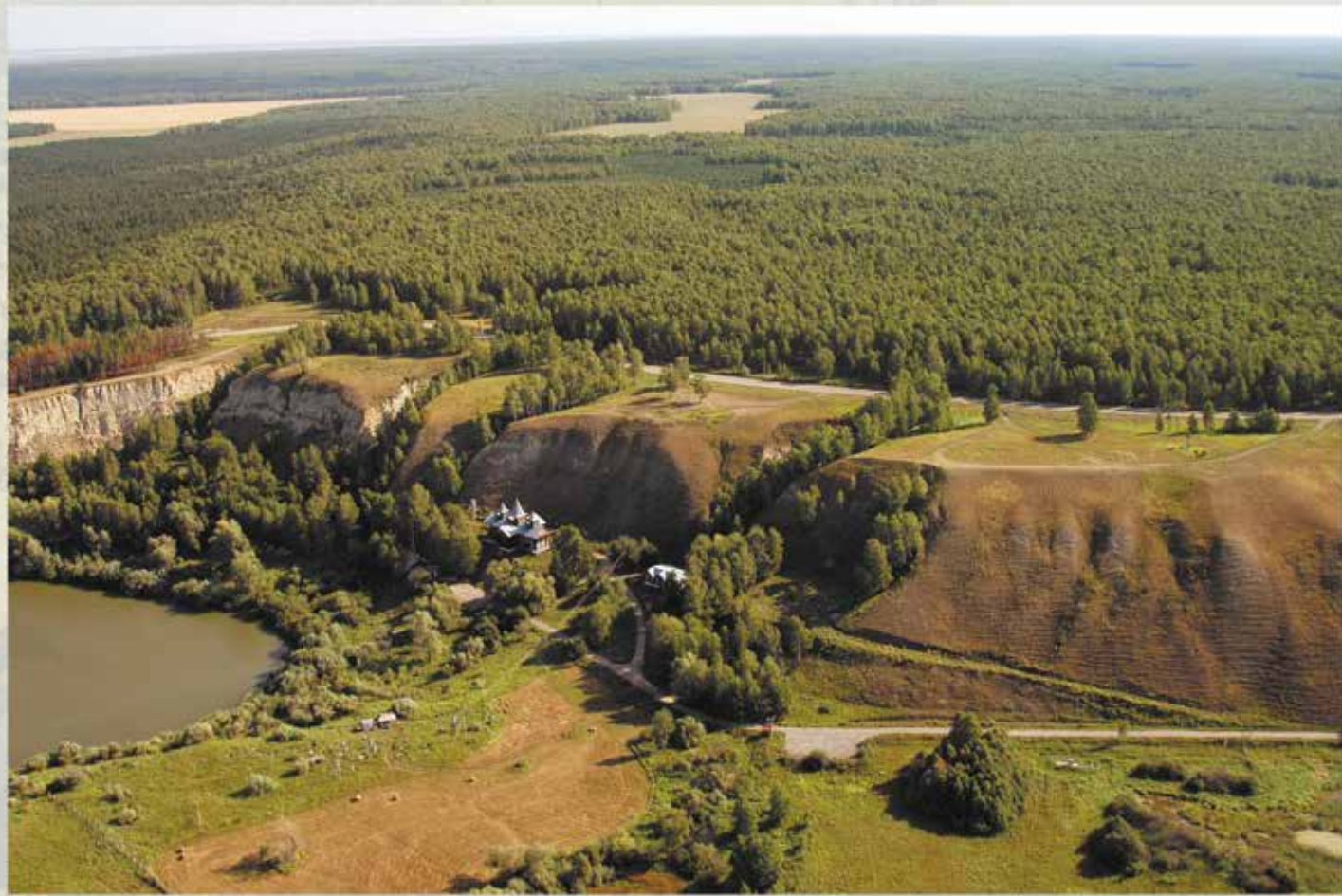
Вид на Синицынский бор