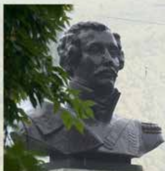
памятник поэту-декабристу Александру Одоевскому