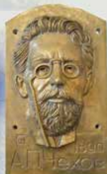
барельеф, посвященный великому писателю, А.П.Чехову